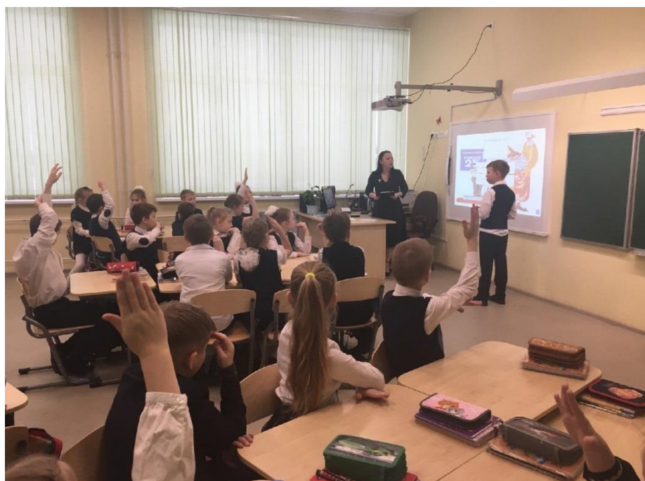
Рисунок. Открытый урок литературного чтения в 3 Д классе.